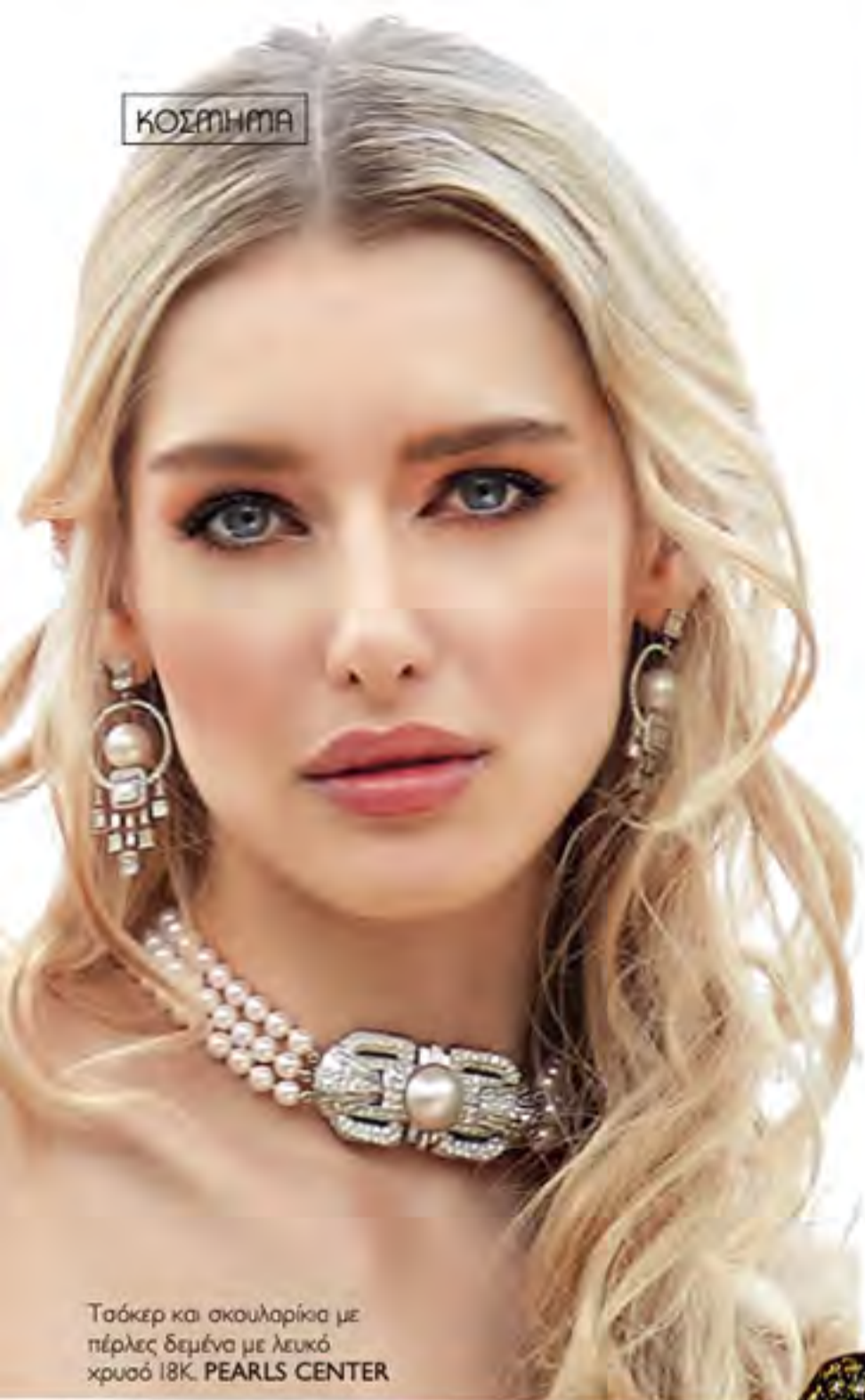
Τσάκερ και σκουλαρίκια με πέρλες δεμένα με λευκό χρυσό 18K. PEARLS CENTER