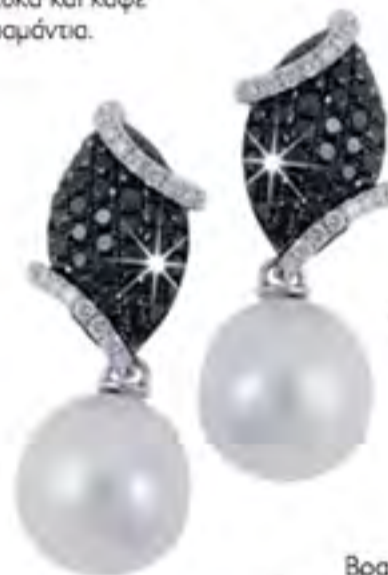
Σκουλαρίκια με μαργαριτάρι, μπριγιάν και μπλε ζαφείρια δεμένα με λευκό χρυσό 18K.