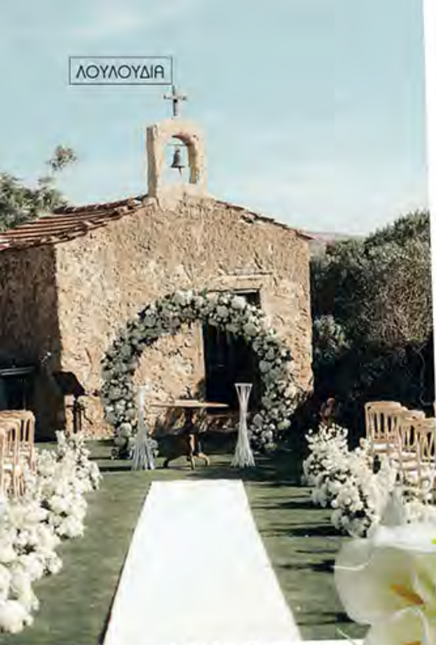
Λουλούδια: Flowers BONSAI by Dimitris Ballas